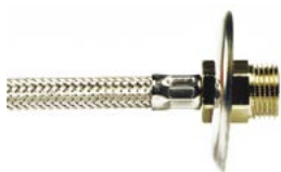
Raccordo F con guarnizione inserita