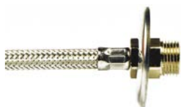
Raccordo F con guarnizione inserita